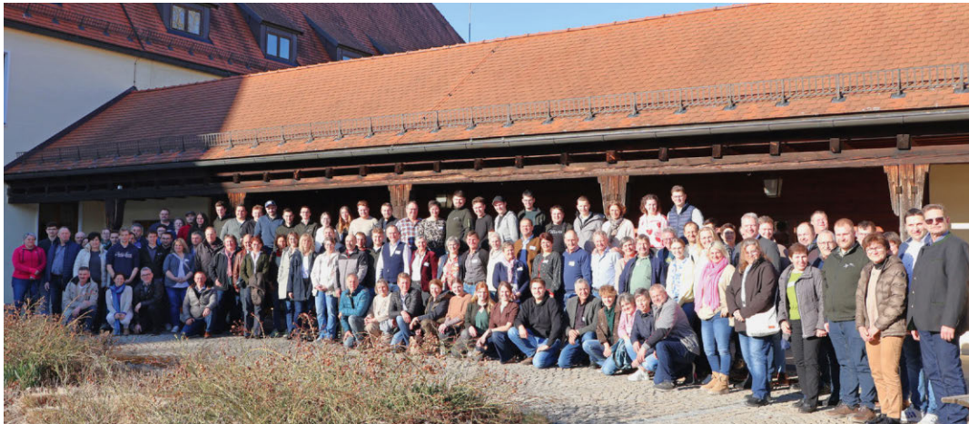
Das Elternseminar bot eine gute Gelegenheit andere Familien sowie die Lehrkräfte kennenzulernen.