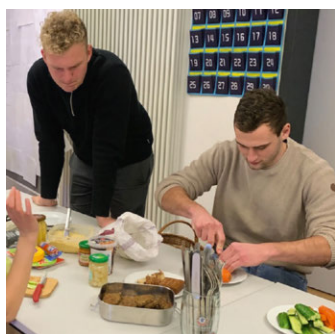
Eine rein pflanzliche Brotzeit rundete den ersten Workshop der Workshopreihe „Klima? Gemeinsam anpacken!“ ab.

Triesdorf Seit über einem Jahr ist der vlf Bayern e.V. Projektträger des Wertebündnisprojekts „Landwirtschaft im KlimaWandel“. Auch in diesem Winter fand unter dem Motto „Klima? Gemeinsam anpacken“ eine dreiteilige Workshopreihe an der Technikerschule Triesdorf statt. Studenten und Studentinnen der Technikerschule und der NAJU Hochschulgruppe der HSWT haben sich dazu mit der KLJB Eichstätt getroffen. Im ersten Workshop lag der Schwerpunkt auf folgenden Fragen: Wie hoch ist mein persönlicher CO 2 -Fußabdruck und wie kann ich bei mir zu Hause konkret Klimagas einsparen? Ein Klimaquiz sorgte da bei den Teilnehmenden für Überraschung: „Mir war nicht bewusst, wie ich mit einigen wenigen Hebeln einiges bewirken kann“, so ein Teilnehmer. Der zweite Workshop stand dann unter dem Motto „Kli-