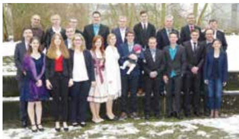
Absolventinnen und Absolventen der Abteilung Landwirtschaft