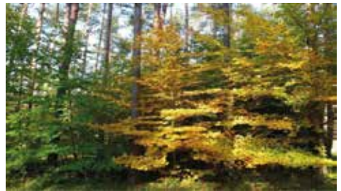
Vorausverjüngter, stabiler und ertragsreicher Wald

den schlanken und wenig stabilen Bäumen manchmal gehörig zu, und den Käfer gab es auch schon zu Urgroßvaters Zeiten. Wie sieht es heute mit dem bäuerlichen Wald aus? Schaut man sich die Wälder an, gewinnt man den Eindruck, dass viele das Konzept der Altvorderen weiterverfolgen: Einschlag der dünnen Bäume zur Brennholzgewinnung und Ernte von Stammholz nur, wenn dies benötigt wird. Es stellt sich die Frage, ob dieses Vorgehen, in der Sprache der Anlageberater, die optimale Anlagestrategie ist. Wenn wir uns wegen einer Geldanlage von einem seriösen Anlageberater beraten lassen, wird er uns zuerst nach unserer Risikobereitschaft fragen. Die meisten von uns scheuen großes Risiko und wählen lieber eine Anlageform, die sicher ist. Ein kleiner Zinsertrag wäre auch nicht schlecht. Wir wissen auch ohne Anlageberater, dass derzeit kein Zinsertrag möglich ist und dass unser Kapital auf dem Sparbuch aufgrund der derzeitigen Inflationsrate von 2,1 %