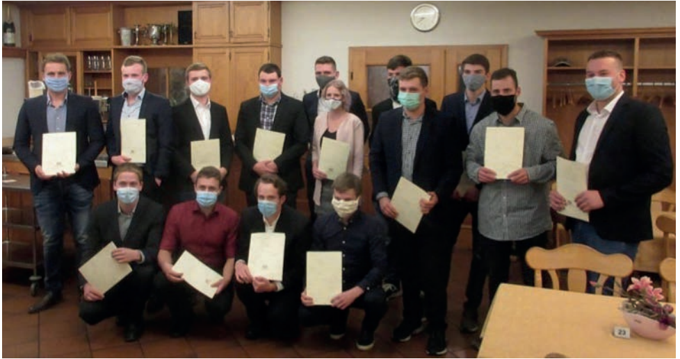
Gruppenbild nach der Zeugnisübergabe