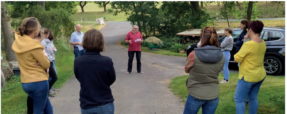
Die Studierenden der Abteilung Hauswirtschaft bei der Exkursion „Ökologischer Landbau“