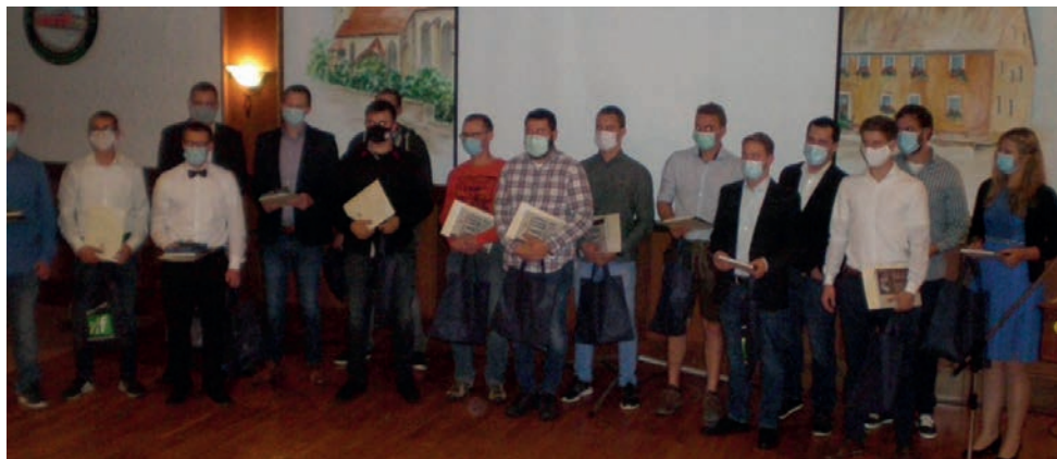
Die erfolgreichen Landwirte und die Landwirte bei der Zeugnisübergabe

paritätisch besetzt sein. Es muss je ein Vertreter der Arbeitgeber und Arbeitnehmer und eine Lehrkraft an der Prüfung mitwirken.