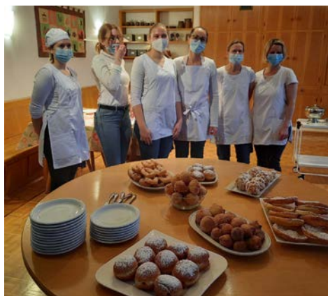
Studierende präsentieren Schmalzgebäck als Ergebnis des Kochunterrichts

Mit dem Bäuerinnen-Cafe hoffen wir auf viele Besucherinnen und Besucher.