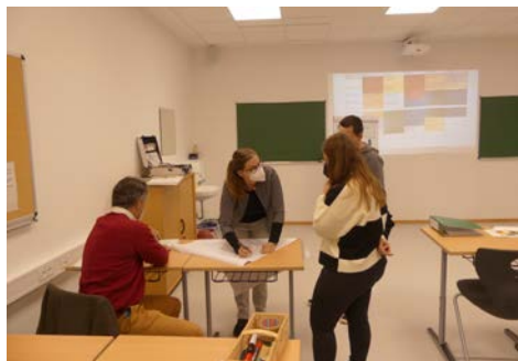
Die renovierten Schulräume gewährleisten eine gute Lernatmosphäre

Während des Semesters musste ein Studierender aus gesundheitlichen Gründen den Besuch der Schule beenden.