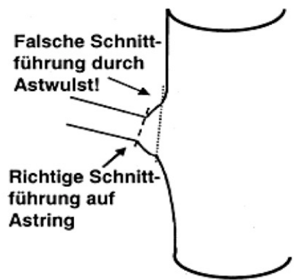
Abbildung 2: Schnittführung Laubholz