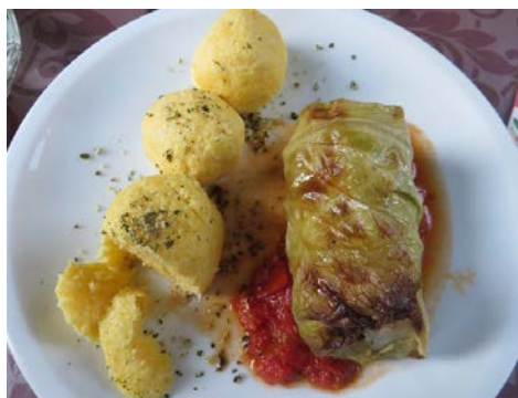
Kohlrouladen mit Walnuss-Gemüsefüllung und Polentaknödel

oder das Walnussöl – sie werden auch das flüssige Gold genannt. Der Preis für Traubenkernöl liegt bei 120 € pro Liter. Dieses aromatische Öl wird gerne zur Verfeinerung von Desserts und Salaten verwendet. In der Mittagspause hatten die Ernährungsreferentinnen das Vergnügen, mal