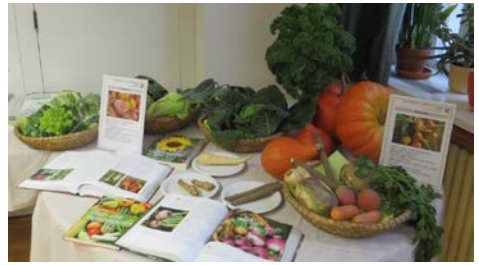
Alte Sorten können die Vielfalt in der Küche und im Garten steigern

Beim Milchviehhaltertage standen Informationen zum Tierwohl und zur Weidewirtschaft im Mittelpunkt. Gerade der Bericht von Markus Dillinger aus dem Landkreis Kelheim zeigte, dass Weidewirtschaft von Milchvieh nicht nur im klassischen Voralpengebiet möglich ist. Mit der Mehrgefahrenversicherung und dem Einsatz moderner Hacktechnik