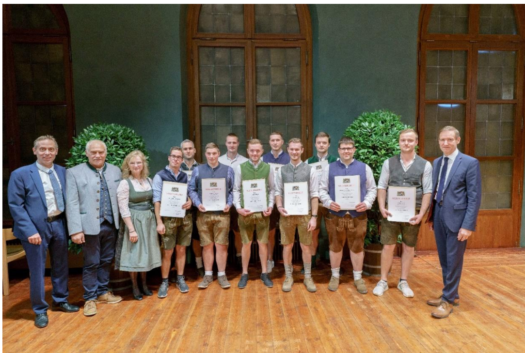
Meister Landkreis Passau