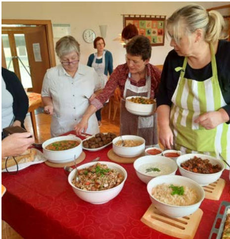
Bei der Schulung wird ein Buffet mit den zubereiteten Speisen vorbereitet.

Hülsenfrüchte erleben besonders auf dem Markt der Ersatzprodukte aufgrund der veränderten Ernährungsgewohnheiten der Gesellschaft einen Boom. Neben dem guten ernährungsphysiologischen Profil sprechen auch die ökologischen Gründe für die Hülsenfrüchte. So ist die Emission von Treibhausgasen und der Wasserverbrauch bei der Herstellung von pflanzlichen Lebensmitteln im Vergleich zu den tierischen Lebensmitteln deutlich geringer. Ein regionaler Anbau von Hülsenfrüchten hätte in diesem Zusammenhang weitere positive Effekte, denn er würde kürzere Transportwege, mehr Transparenz für die Verbraucher, Unabhängigkeit von Importen und Gentechnikfreiheit bedeuten. Zudem reduzieren Hülsenfrüchte den Einsatz von stickstoffhaltigem Dünger und sorgen auf den Feldern für mehr Biodiversität. Die Anbauflächen von Hülsenfrüchten in Bayern sind in den letzten Jahren