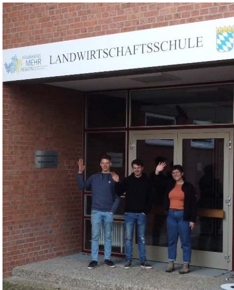
Studierenden des Praxissemester 2023 der Landwirtschaftsschule Uffenheim am Praxistag „Soziale Medien“

Bei einem dieser Praxistage beschäftigen sich die zukünftigen Studierenden auch mit den neuen Medien.