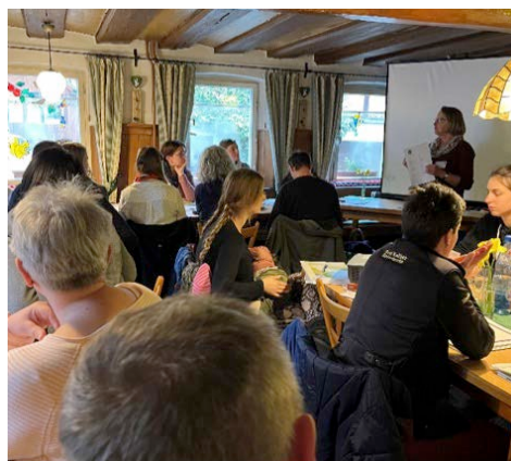
Auf reges Interesse stießen die Vorträge beim FIT-Tag

Herr Siemandel von der SVLFG informierte, wie die Betriebe mit einfachen Mitteln die Sicherheit der Schüler auf dem Bauernhof erhöhen können, um Unfallgefahren und den damit zusammenhängenden Konsequenzen zu vermeiden.