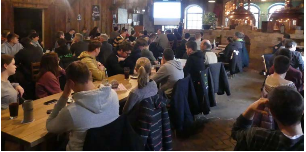
Blick in die gut besetzten Kohlenmühle beim Milchviehaltertag

biotikamonitorings, welcher aufgrund einer Novelle des Tierarzneimittelgesetzes neue Regelungen mit sich bringt. So sind unter anderem nun auch Tierhaltungsbetriebe, die im Erfassungshalbjahr mehr als 25 Milchrinder (ab der ersten Abkalbung) halten, dazu verpflichtet, ihren Tierbestand sowie Bestandsveränderungen in einer amtlichen Datenbank (HIT-Datenbank) anzugeben. Gleichzeitig müssen Tierärztinnen und Tierärzte jede Verschreibung, Anwendung oder Abgabe von antibiotisch wirksamen Arzneimitteln in ebene Datenbank melden, sodass auf dieser Datengrundlage eine einzelbetriebliche Therapiehäufigkeit ermittelt werden kann. Ziel ist es, Gründe für häufigen Antibiotikaeinsatz zu ermitteln und Reduktionsmaßnahmen einzuleiten.