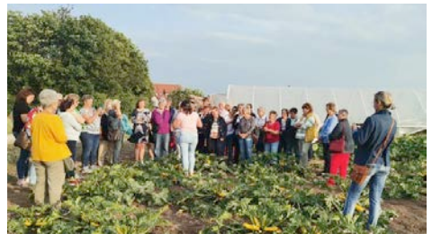
Besichtigung der Zucchiniflächen am Betrieb Zeller.