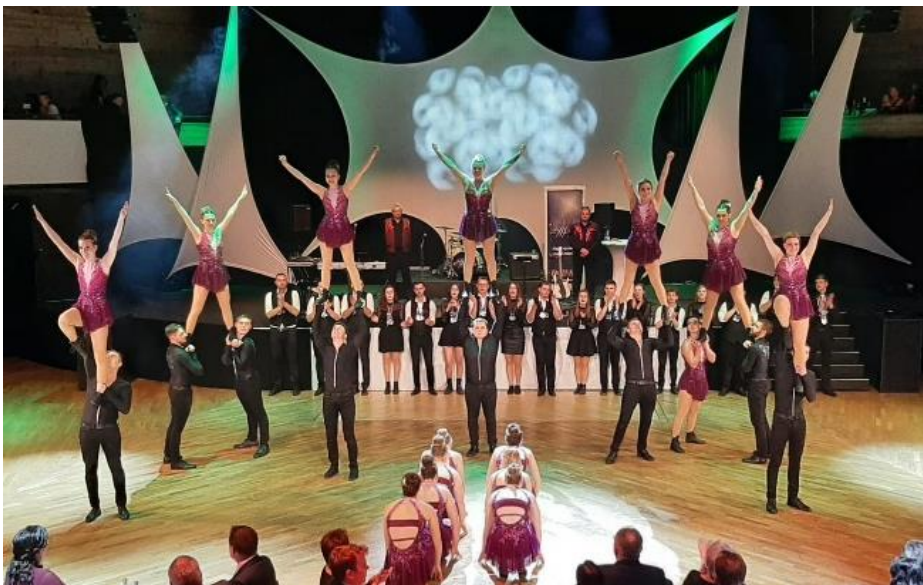
Auftritt der Preither Garde beim Landwirtschaftsball 2024

Idee: Schenken Sie Ihren jungen Familienmitgliedern einen Ballbesuch!