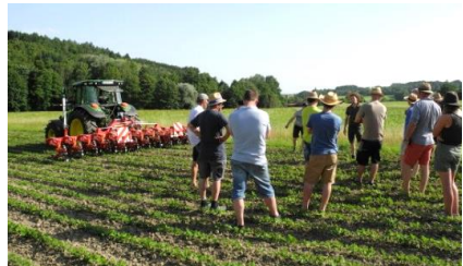
Vorführung einer „Foto-Hacke“ Neu-Umsteller Bio

Das BioRegio Betriebsnetz bietet umstellungsinteressierten und Bio-Landwirten*innen die sog. „Bauer-zu-Bauer-Gespräche“ auf Bio-Betrieben zu verschiedenen fachlichen Themenstellungen an. Die Betriebsleiter*innen teilen ihre langjährige Erfahrung und geben ihr Wissen gerne an die Berufskollegen weiter. Sie haben die Möglichkeit Fragen und Probleme mit erfahrenen Bio-Berufskollegen zu diskutieren. Dabei werden Ideen und Erfahrungen ausgetauscht, Lösungen gefunden und Netzwerke geknüpft. Alle Termine und Veranstaltungen des BioRegio Netzwerkes finden Sie auf der Seite der Bayerischen Landesanstalt für Landwirtschaft unter „Ökologischer Landbau“ - Link: