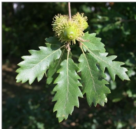
Blätter und Früchte der Zerreiche

Hinweis zum Schluss: viele der klimatoleranten Baumarten sind Lichtbaumarten – also nutzen Sie die aktuell guten Holzpreise und schaffen Sie in ihrem Wald Platz für Neues.