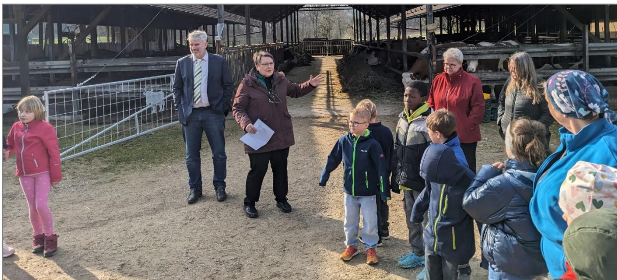
Grundschulklasse aus Heuchling erlebt unvergesslichen Tag auf dem Bauernhof Koulersbauer in Schnaittach, Foto: AELF

Die diesjährige Auftaktveranstaltung auf Regierungsebene für die Aktiv-Wochen Erlebnis Bauernhof fand Anfang April auf dem Erlebnisbauernhof Koulersbauer in Schnaittach im Nürnberger Land mit der Grundschule Lauf/Heuchling statt.